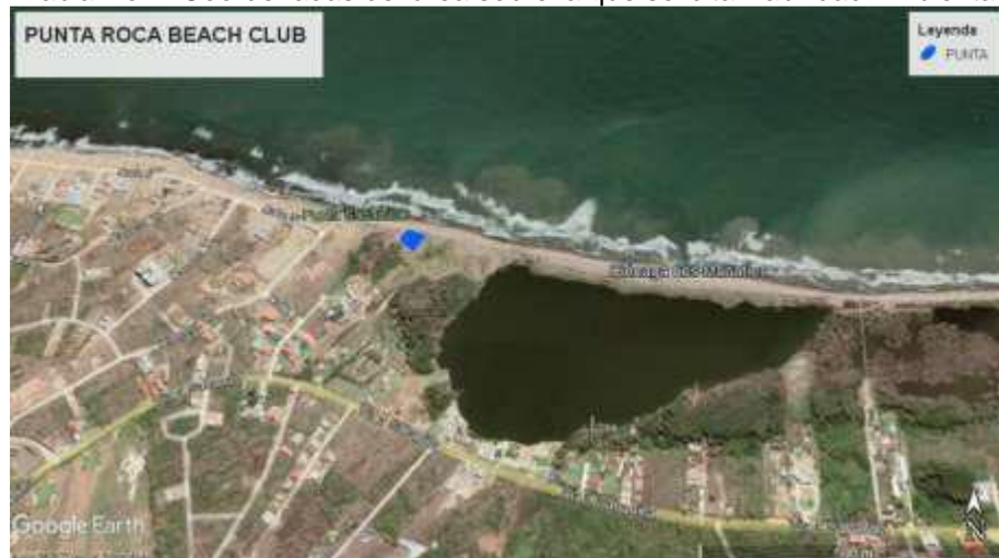
Tabla No 1. Coordenadas del área sobre la que solicita viabilidad Ambiental

Que personal adscrito a la Subdirección de Gestión Ambiental de esta Corporación, realizo visita de inspección técnica al sitio objeto de la solicitud, el día 21 de julio de 2022, emitiendo el Informe Técnico No. 432 del 12 de septiembre de 2022.